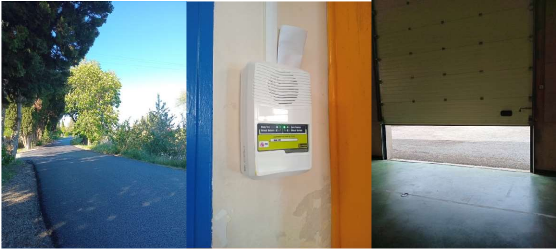
Avenue des lavandières