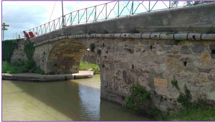
L'état initial du Pont