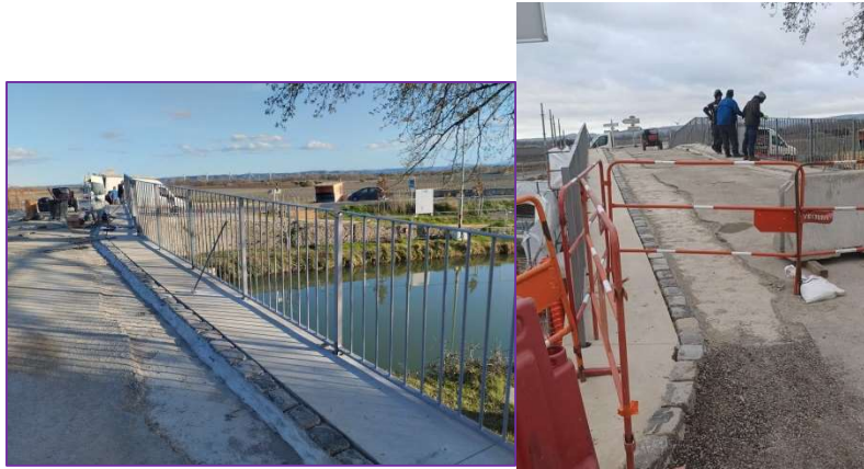
Le pont rénové