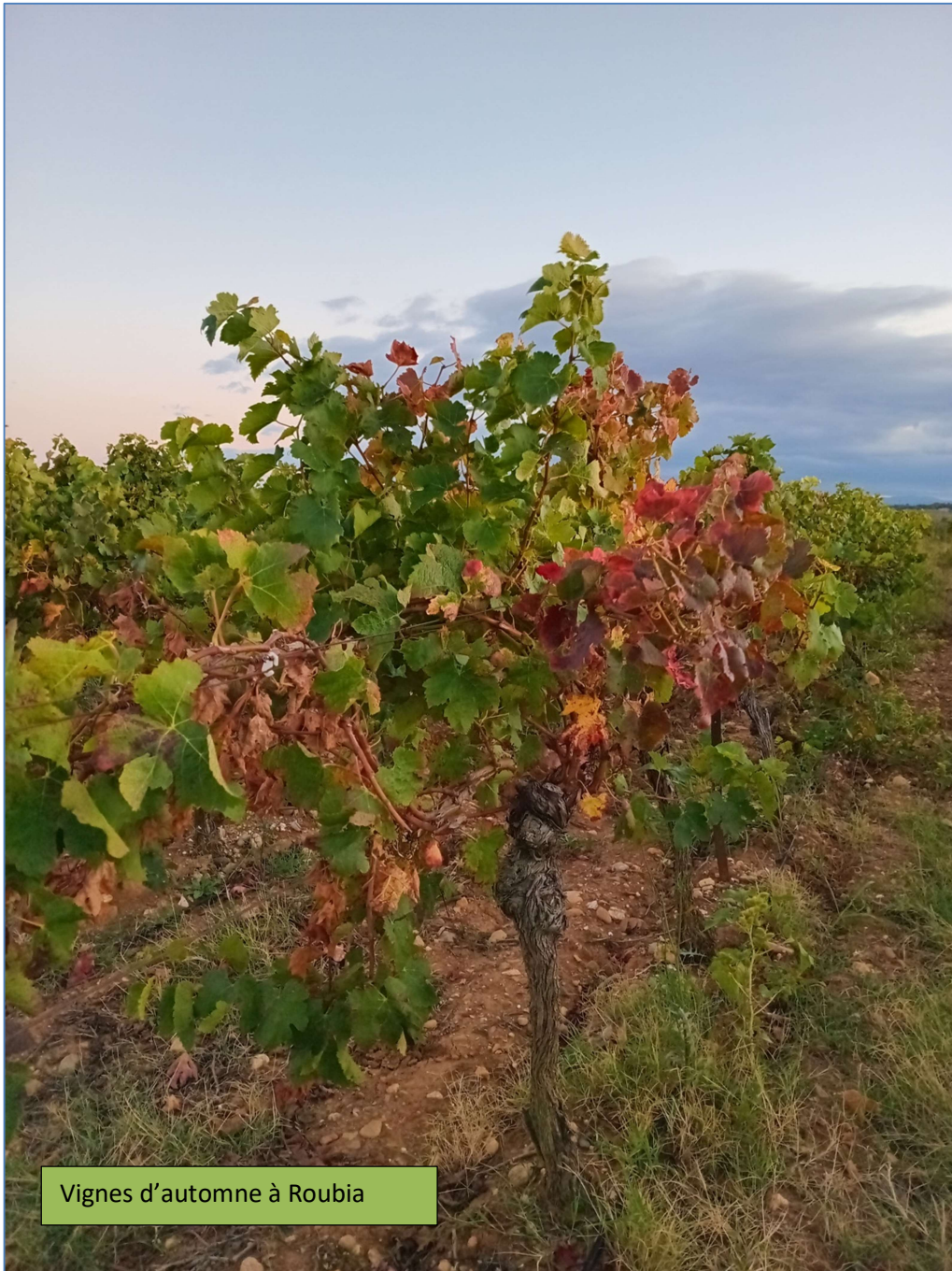
Vignes d'automne à Roubia